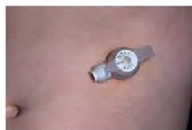
Avanos Mickey Button

Las sondas G pueden ayudar a los niños que necesitan ayuda con la alimentación a largo plazo.