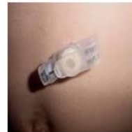
MiniOnE Button ANT